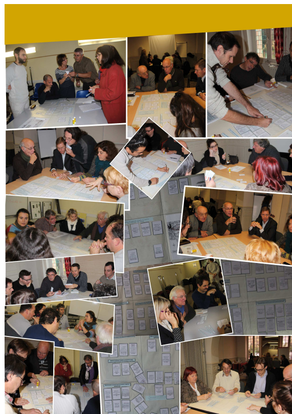
Atelier de concertation “Contrat de Nappe de Crau” le 18 décembre 2013 au domaine du Merle à Salon de Provence