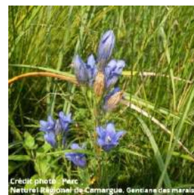
Genciane des marais