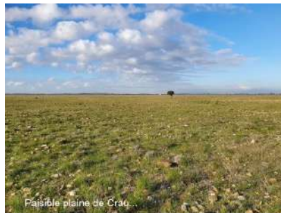
Paisible plaine de Crau...